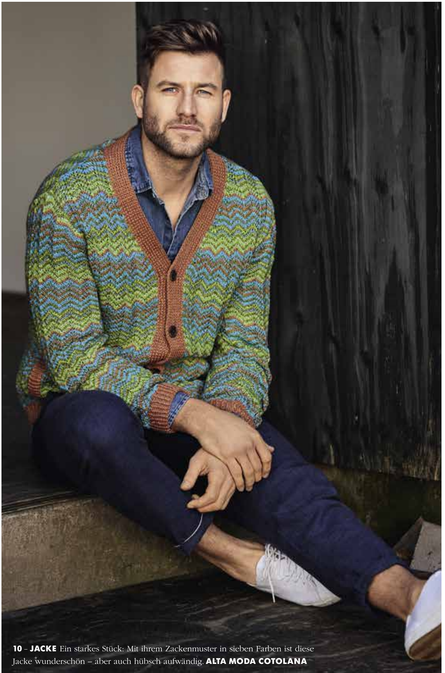
10 - JACKE Ein starkes Stück: Mit ihrem Zackenmuster in sieben Farben ist diese Jacke wunderschön – aber auch hübsch aufwändig. ALTA MODA COTOLANA