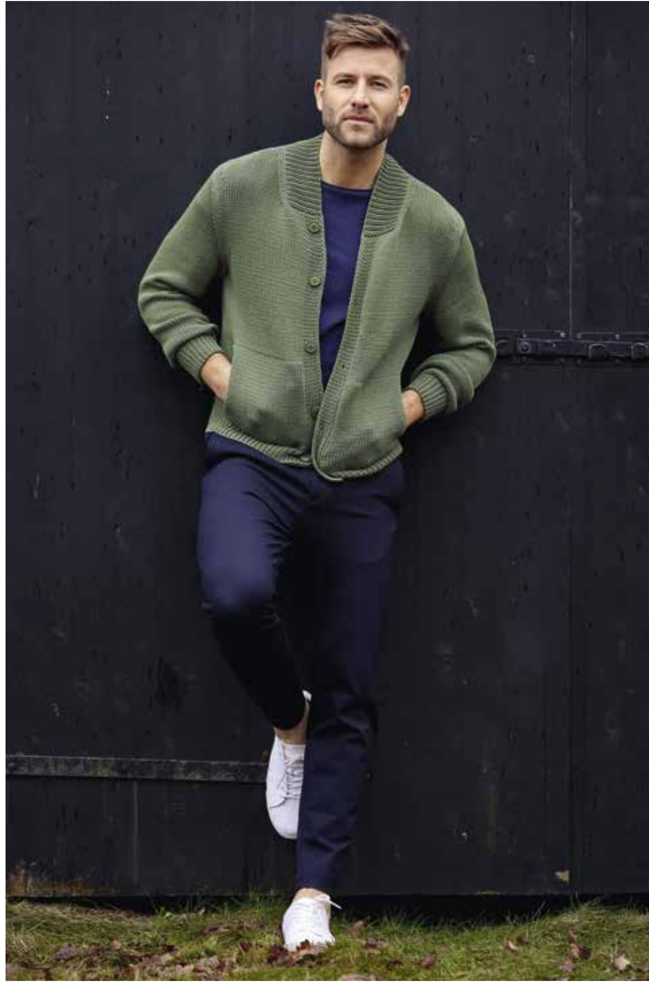
09 - JACKE Rippenkragen, lässiges Graugrün und seitliche Eingriffstaschen – schon hat man eine Bomberjacke. Hier ist sie aus leichtem Schlauchgarn, also sommertauglich und richtig schön soft. RISERVA