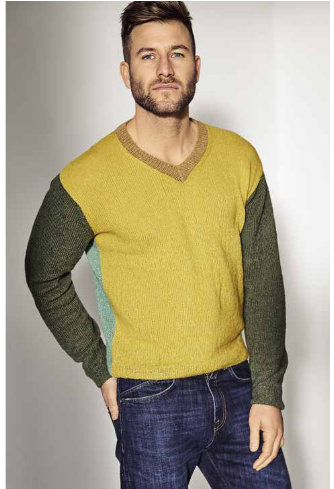
04 - V-PULLI Bunt wirkt cool, wenn es in großen Blöcken daherkommt. Kombiniert werden satte und sanfte Töne, was das Ganze noch interessanter macht. ALLORA