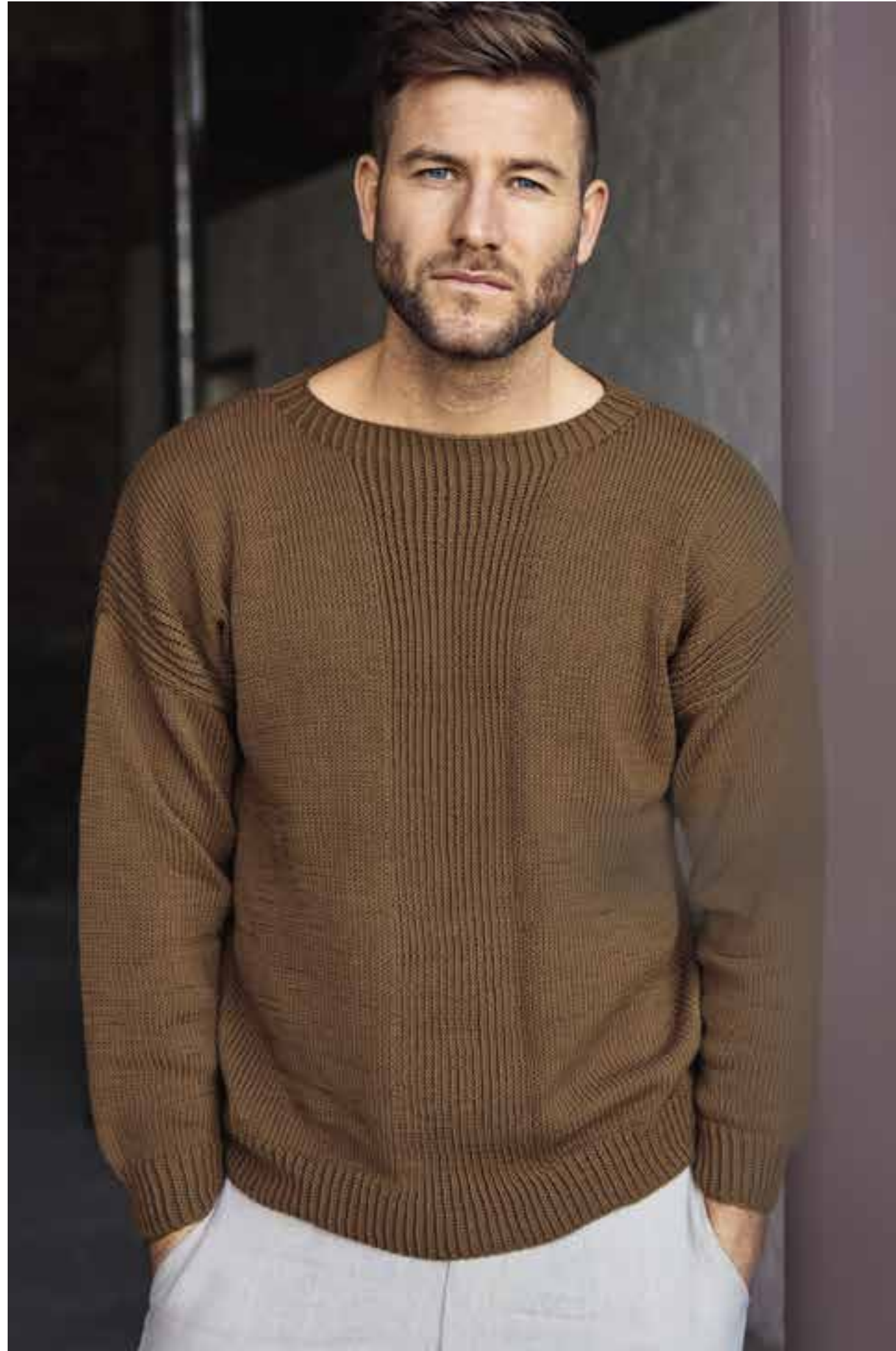
OBEN 05 - PULLI Der kaffeebraune Sweater aus feinsten, glänzender Pima-Baumwolle passt zu Chinos, zu Jeans – und sogar zur Anzughose. PIMA | RECHTE SEITE 06 - JACKE Blockstreifen in Trendfarben verleihen diesem glatt rechts gestrickten Klassiker einen neuen, sommerlichen Twist. FOURSEASON