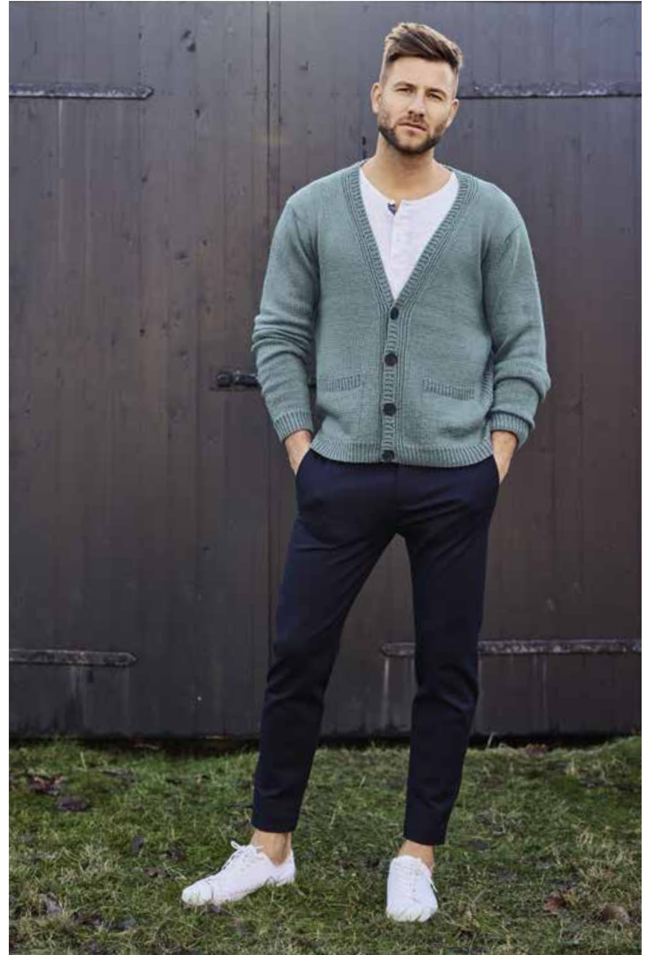
LINKE SEITE 07 - PULLI Weil uns das Farbenspiel von Seite 6 so gut gefiel, hier die Rundhals-Variante mit extrabreiten Blockstreifen. ALLORA | OBEN 08 - JACKE Verschränkte Maschen (Rippenblenden) und eingesetzte Taschen setzen bei dieser Jacke delikate Akzente. Das sanfte Pastelltürkis lässt sich gut kombinieren. Mit Weiß wirkt es frisch, mit Schwarz cool und stylisch. ALTA MODA COTOLANA