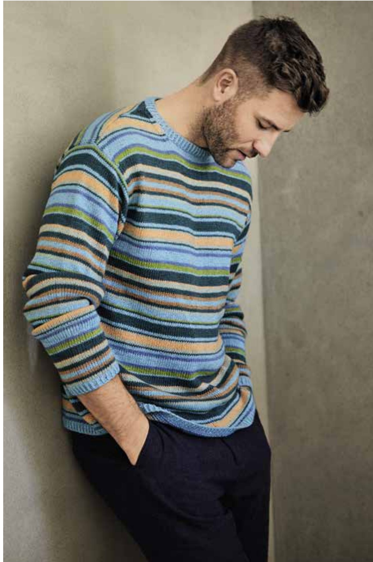
OBEN 02 - PULLI Wie maskulin Ringel wirken können, beweist dieser Sweater mit einem spannenden Mix aus kalten und warmen Tönen. Schwer zu stricken ist er nicht, nur das Vernähen der Fäden macht etwas Mühe. LINARTE | RECHTE SEITE 03 - JACKE Nachtblau, edle Hebemaschenblenden und eingestricke Taschen: Ein Klassiker, wie aus dem Bilderbuch. SOLO LINO