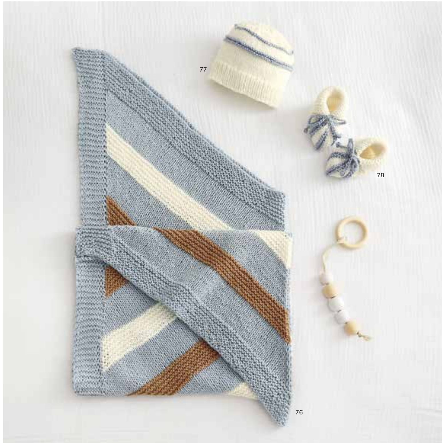
76 - Decke. Alta Moda Cotelana