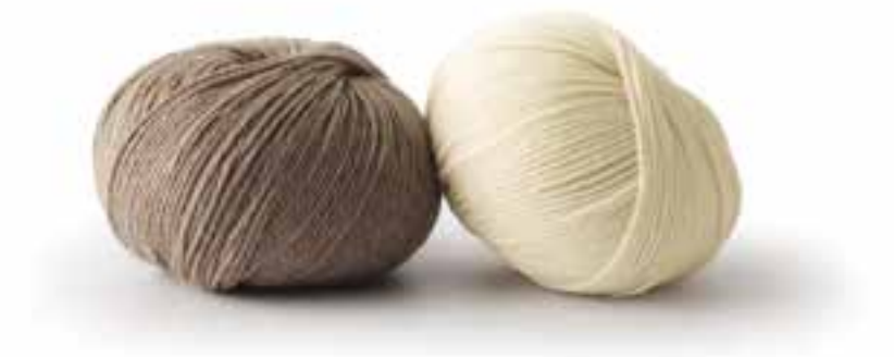
7 - Schnullerkette. Cotone