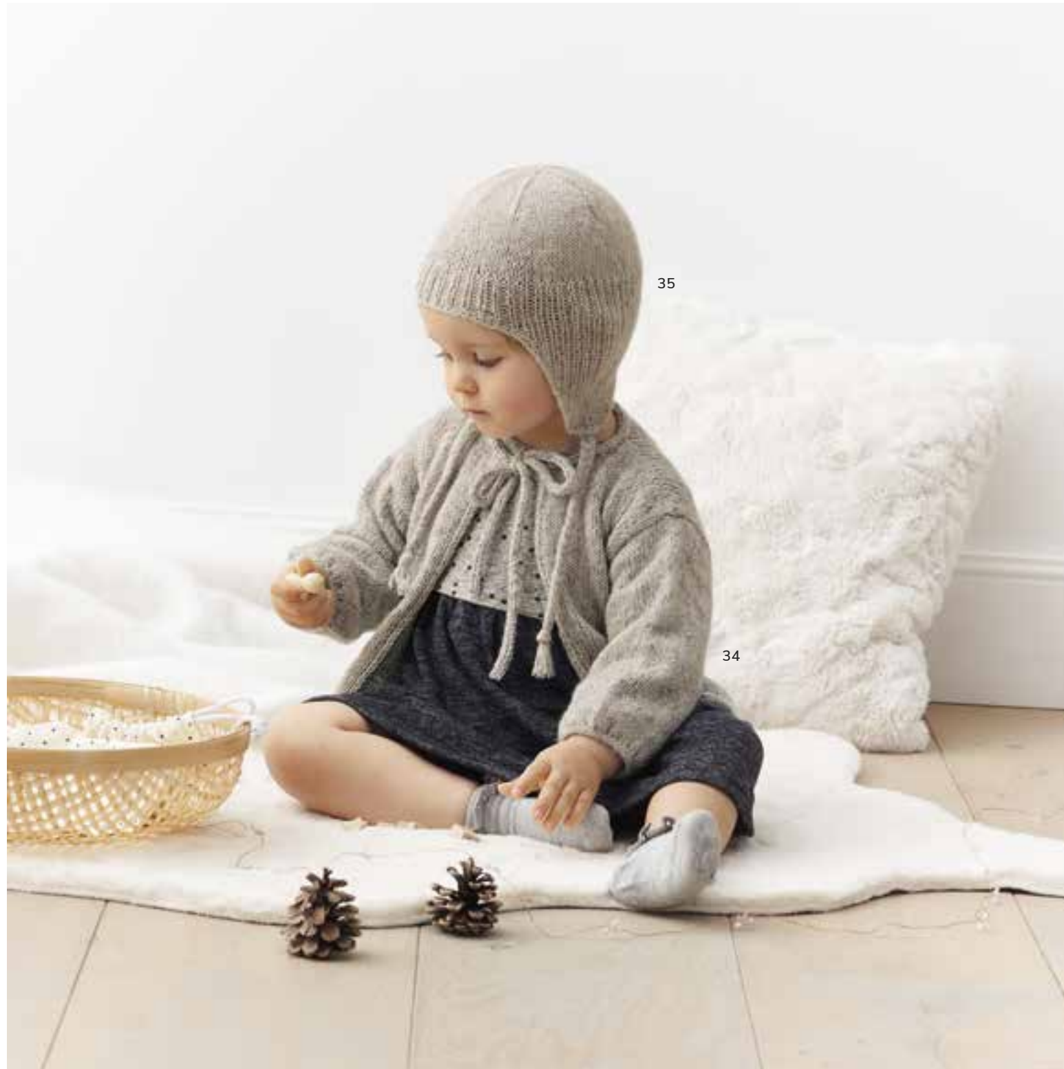
34 - Jacke. Ecopuno