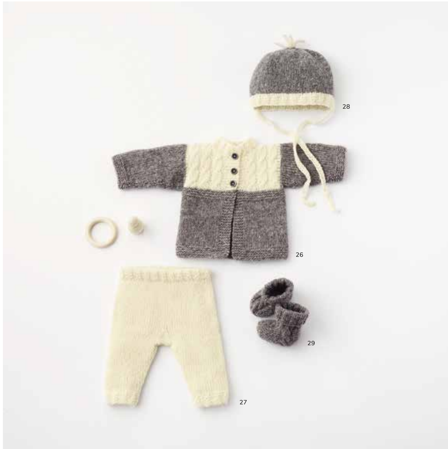
26 - Jacke. Cashmere 16 Fine