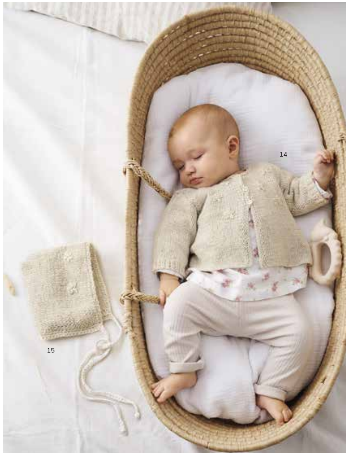
15 - Mütze. Linarte