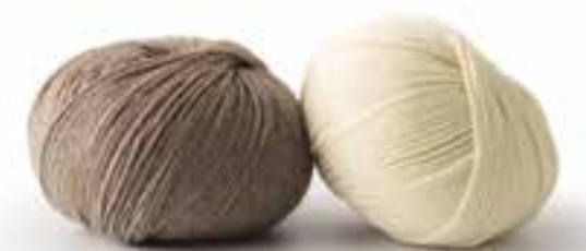
13 - Pullunder. Cool Wool Cashmere