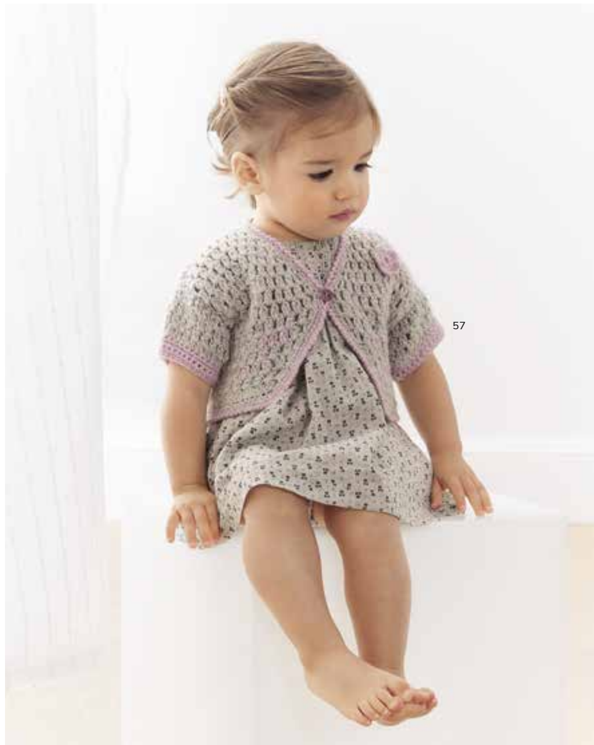
57 - Jacke. Ecopuno

Einen Hauch Pink – mehr braucht es nicht, um kleine Romantiker*innen glücklich zu machen. Softe Garne unterstreichen die bezaubernden Looks. Und wer hübsch brav ist, bekommt zum Kleidchen das Püppchen im Partner-Look.