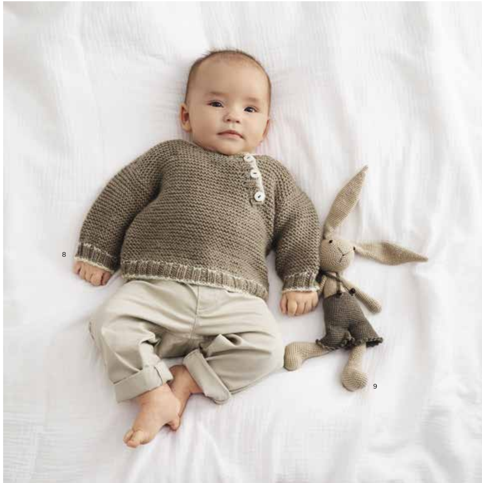
8 - Pulli. Cool Wool Cashmere