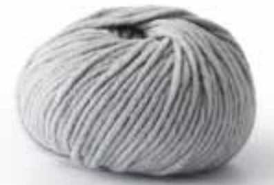
30 - Teppich. Mille II & Elastico