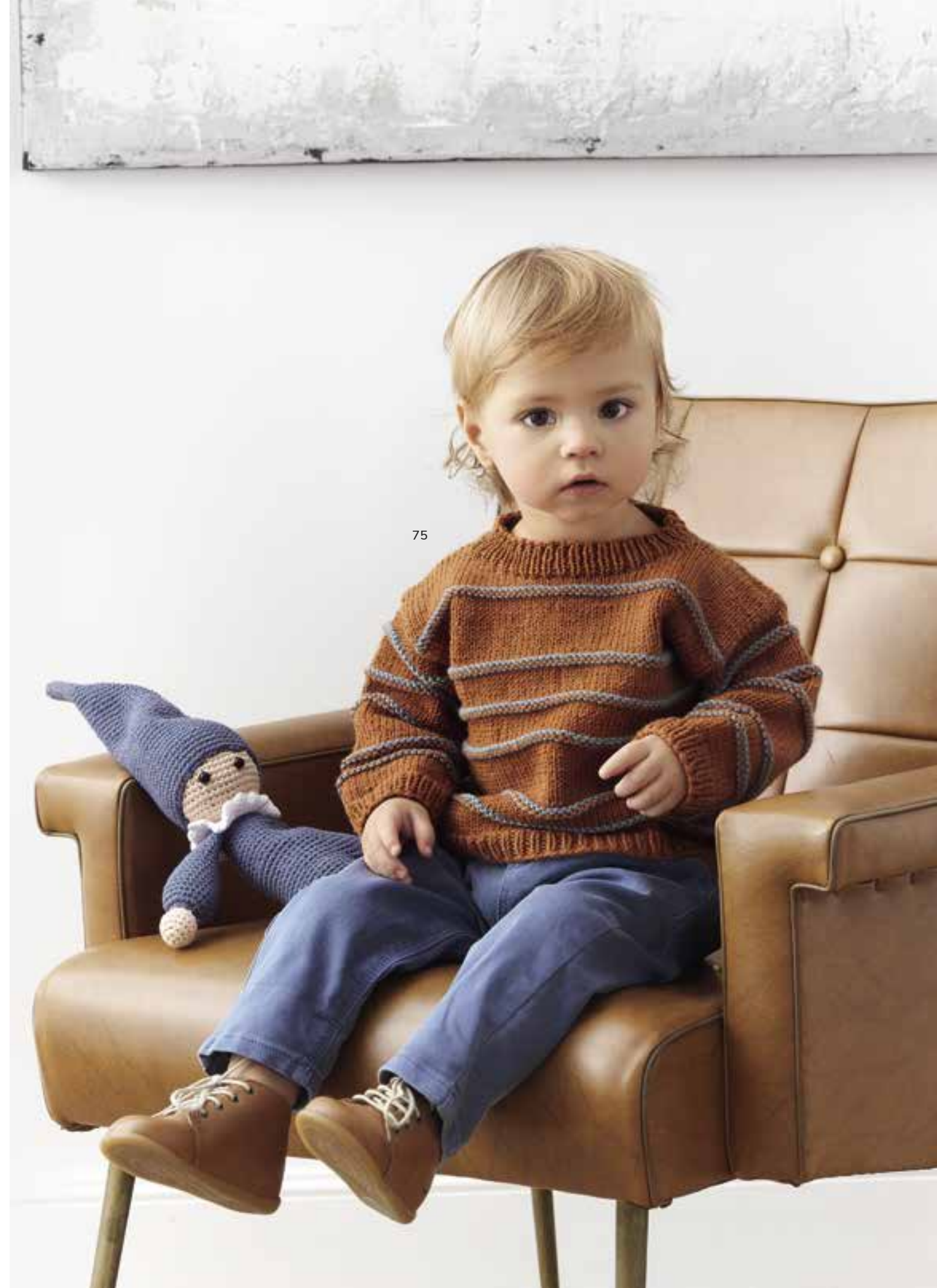
75 - Pulli. Cool Wool Big Mélange & Cool Wool Big