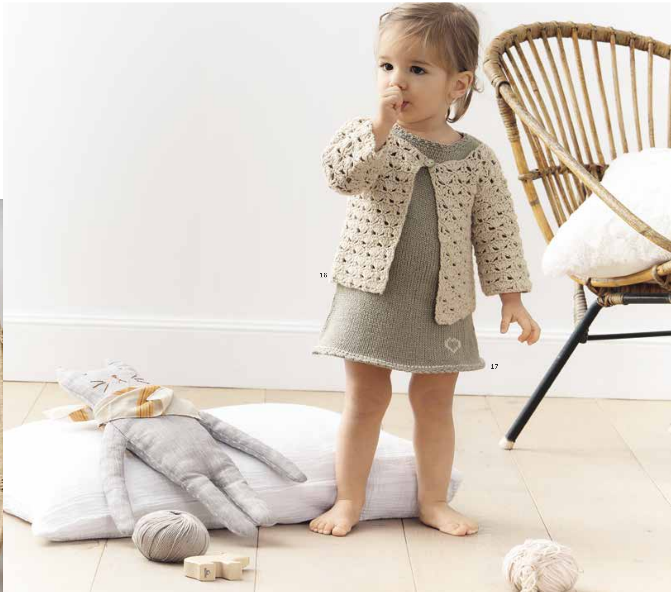
16 - Jacke. Soft Cotton