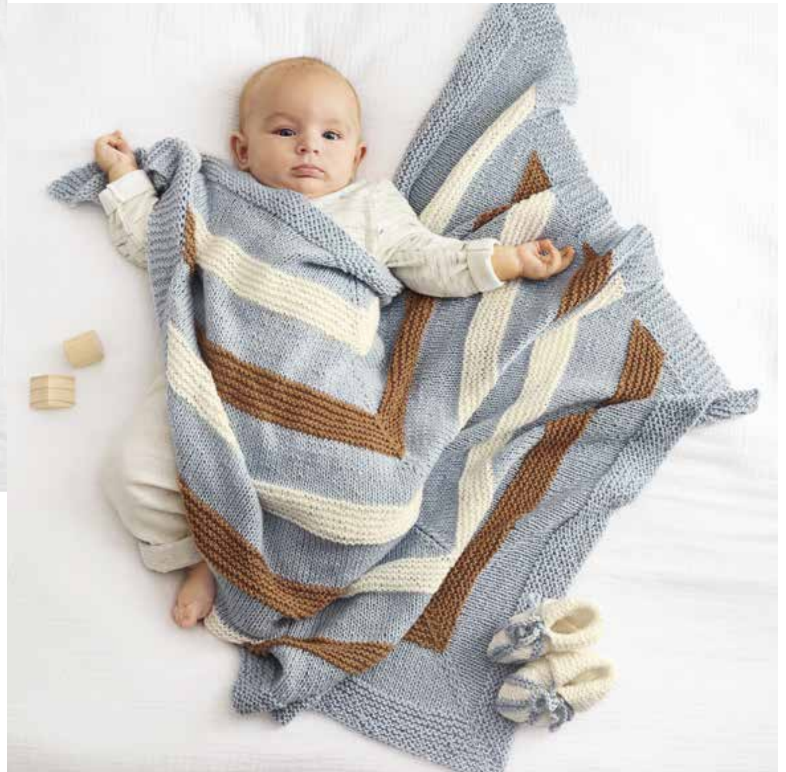
78 - Schuhe. Alta Moda Cotelana