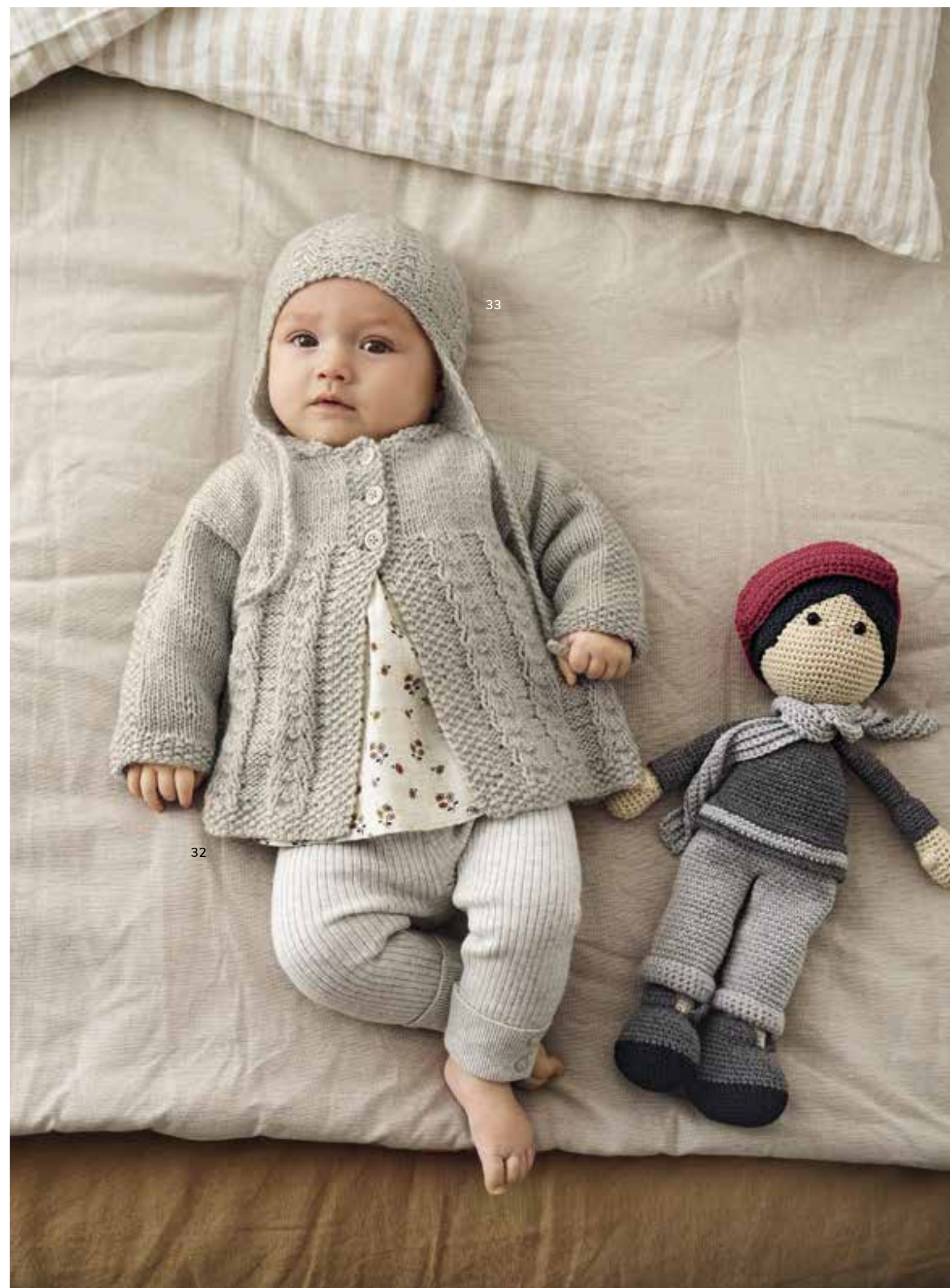
33 - Mütze. Cashmere Puro