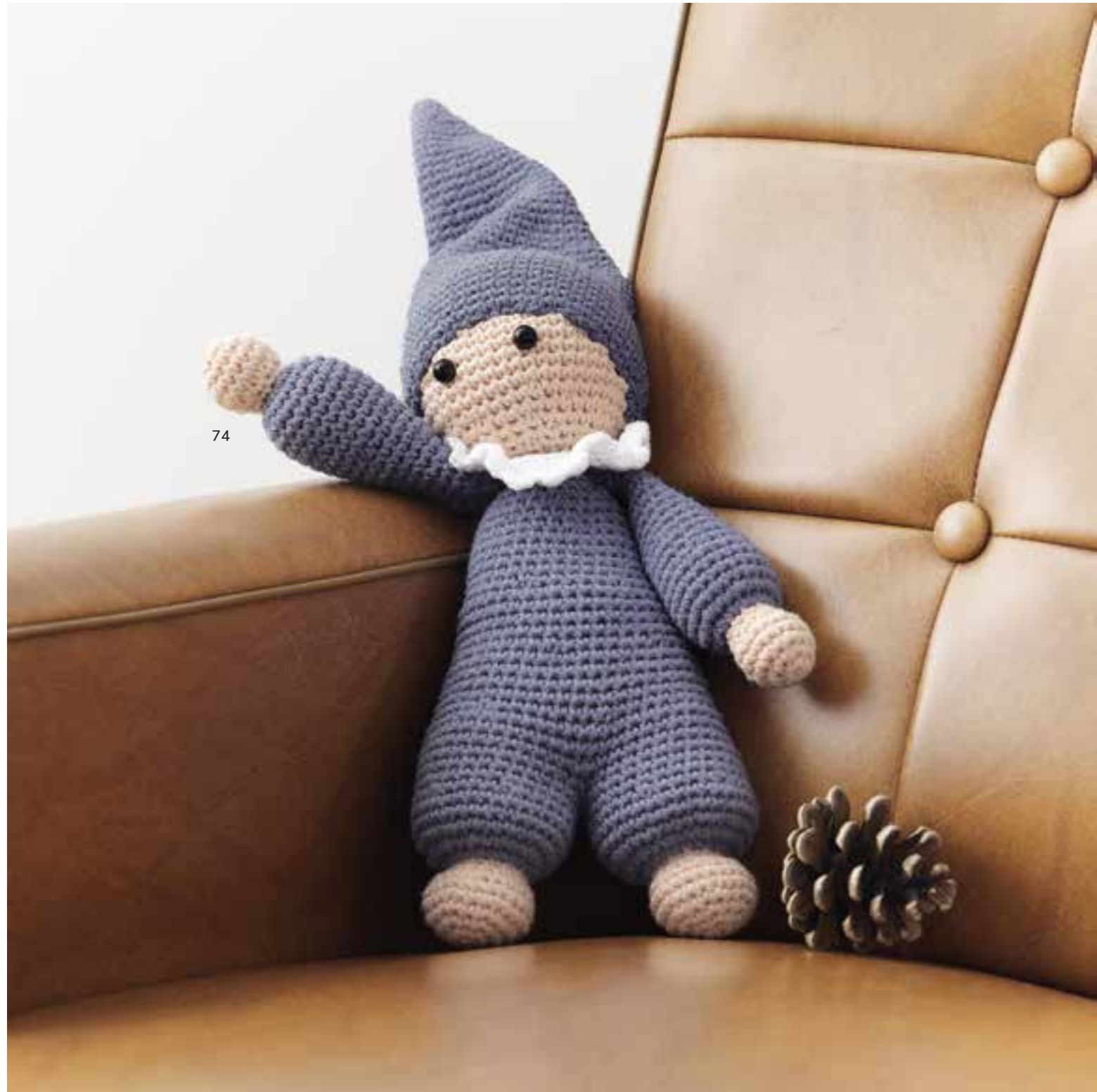
74 - Puppe. Imagine & Elastico