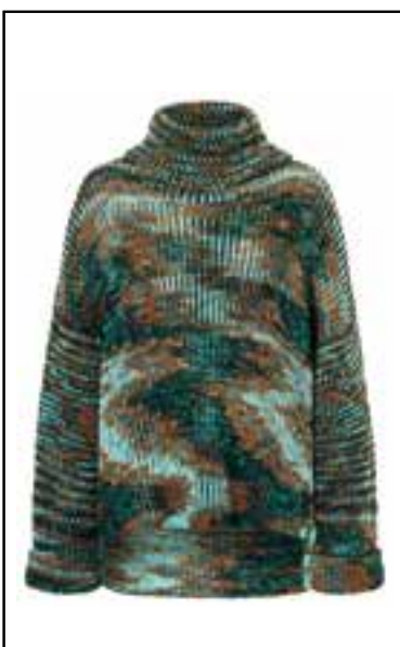
14 MW 100G MERINO HAND-DYED