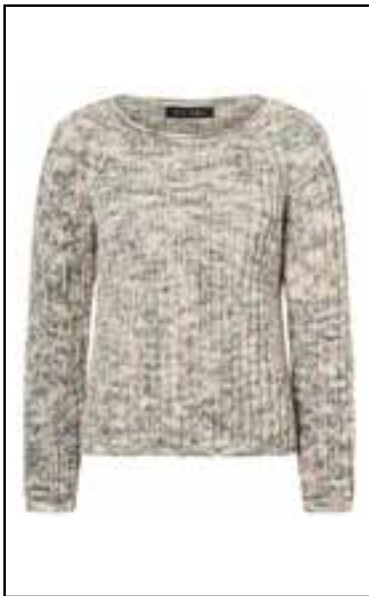
8 COOL WOOL HAND-DYED