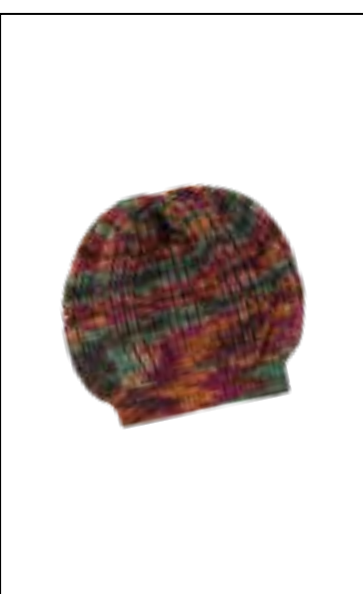
17 MW 100G MERINO HAND-DYED