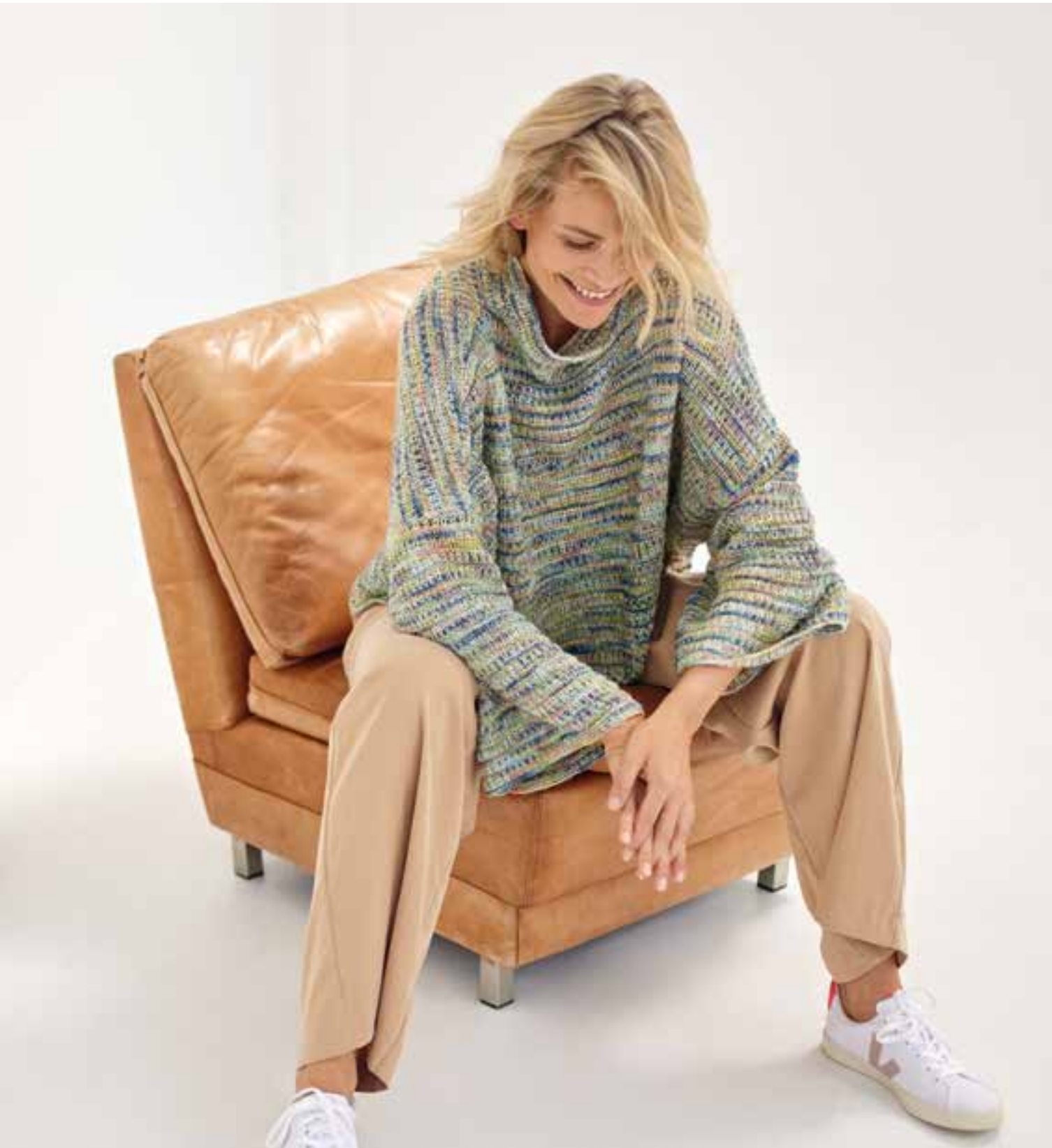
10 – Oversized, mit weiten Dreiviertelärmeln und angesagtem Turtleneck-Kragen: Dieser Sweater ist eine Wucht und trägt, dank starker Schultherschragen, trotzdem nicht auf. ECOPUNO HAND-DYED