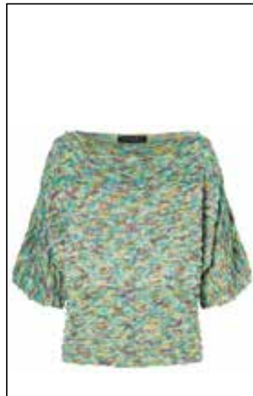
23 ECOPUNO HAND-DYED