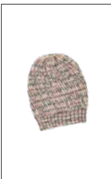
16 COOL WOOL HAND-DYED