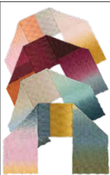
9 COOL WOOL LACE HAND-DYED