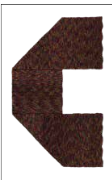
18 MW 100G MERINO HAND-DYED