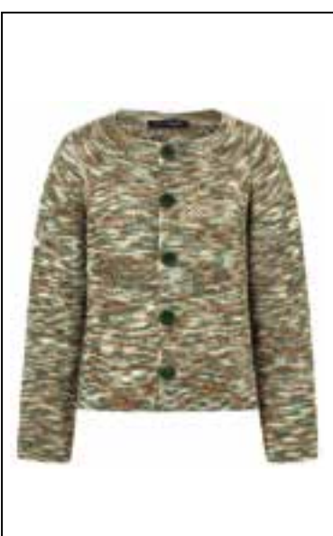
19 COOL WOOL HAND-DYED