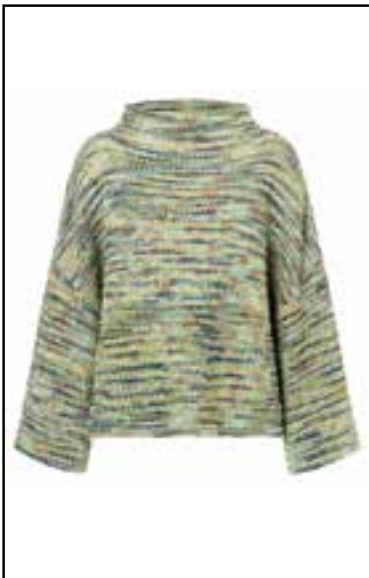
10 ECOPUNO HAND-DYED